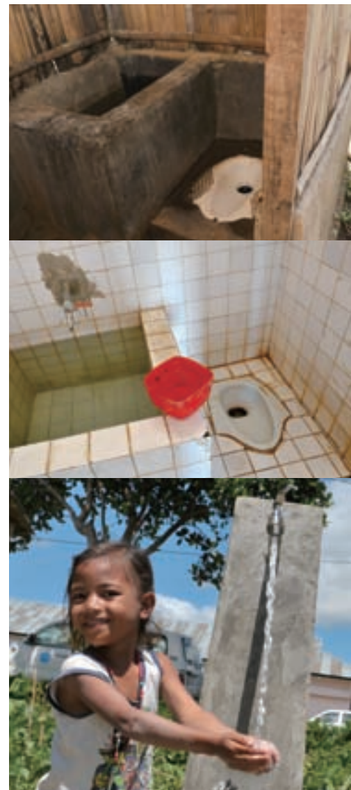
(写真上から) ユニセフの支援によって今までにつくられた家庭用トイレの一例。/学校用トイレの一例。/ユニセフの支援でできた水道で手を洗う少女。

(財団法人日本ユニセフ協会への寄付金は、特定公益増進法人への寄付として税制上の優遇措置の対象となります。詳しくは、日本ユニセフ協会のホームページ http://www.unicef.or.jp/ をご覧ください)