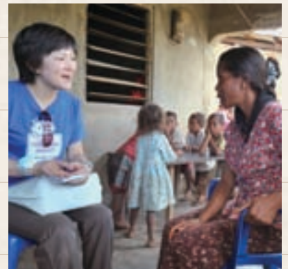
(写真上から) 国内避難民を収容するキャンプに住む子ども。／竹を半分に割っただけの、むき出しの配水管。／プロジェクトチームは東ティモールのさまざまな村で衛生の現状をヒアリング。