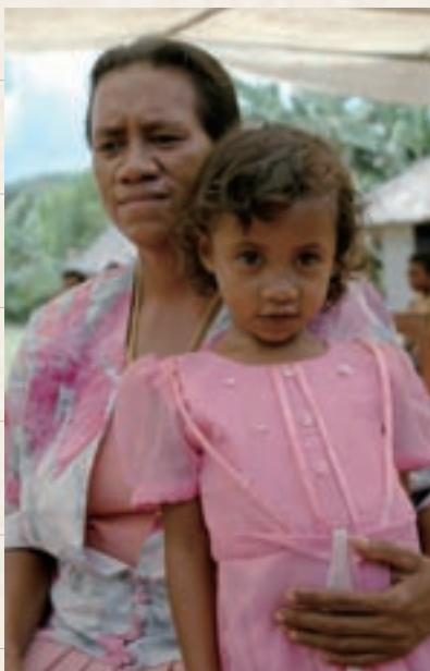
自宅の衛生事情の悪さを嘆く母親。隣にいる4歳の女の子も、以前マラリアをわずらった。

6人の子どもを育てるお母さんの話はショックでした。日々の生活に必要な水は、彼女が毎日1時間歩いてくみに行くと言います。それでも水が足りず、トイレに使う余裕はありません。近所の母親たちも同じ悩みを抱えています。