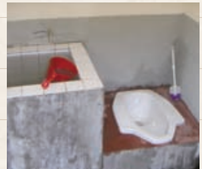
カメラ村の小学校に新設された水洗トイレは個室。衛生的なトイレに児童たちも完成を喜んだ。

高台にある小学校にも、男女別の個室のトイレがつけられました。便器の脇には用を足した後に流す水をためる水槽があり、水道の蛇口をひねれば新鮮な水がたまる仕組みです。建物の外側には手洗い用の蛇口が三つ取り付けられています。村長さんは「以前は、豚がいるような場所で用を足していたのです。水道とトイレが完備したおかげで衛生的な生活が送れるようになり、マラリアが減りました」と話してくれました。児童たちは、頻繁に手を洗う習慣が身